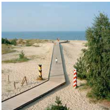
—o Allemagne - Pologne