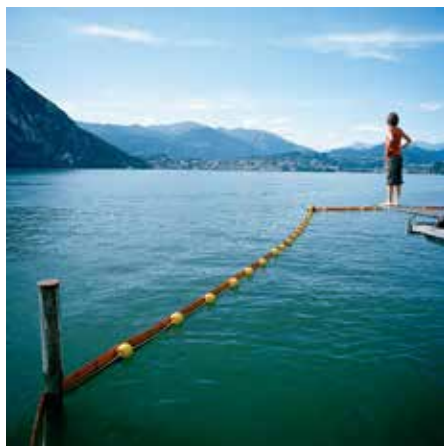
—o Suisse - Italie