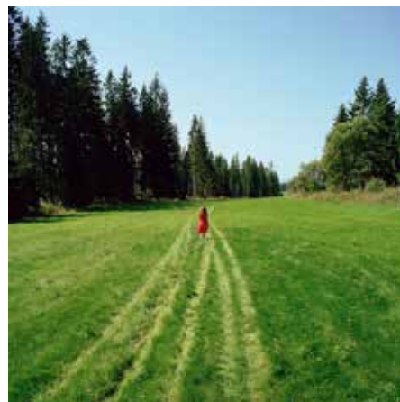
—o Pologne - Slovaquie

En cette année européenne du patrimoine culturel, le projet Borderline, les frontières de la paix montre un aspect inédit du patrimoine européen : ses frontières internes.